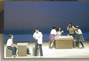
東高校演劇部 Drama club